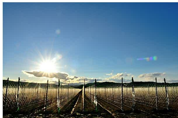
入選 長友逸郎氏「初夏の光」 (音更町)