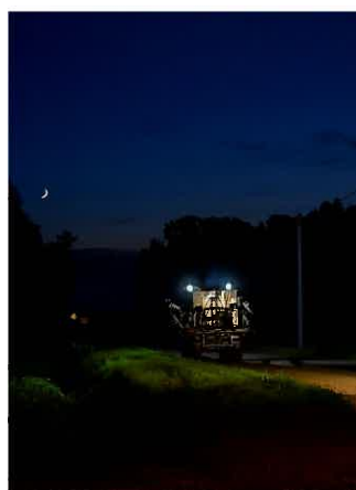
入選 高谷誠氏「おつかれさまです。」 (音更町)