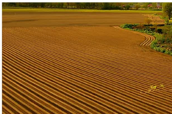
入選 南出基氏「大地の文様」 (清水町)